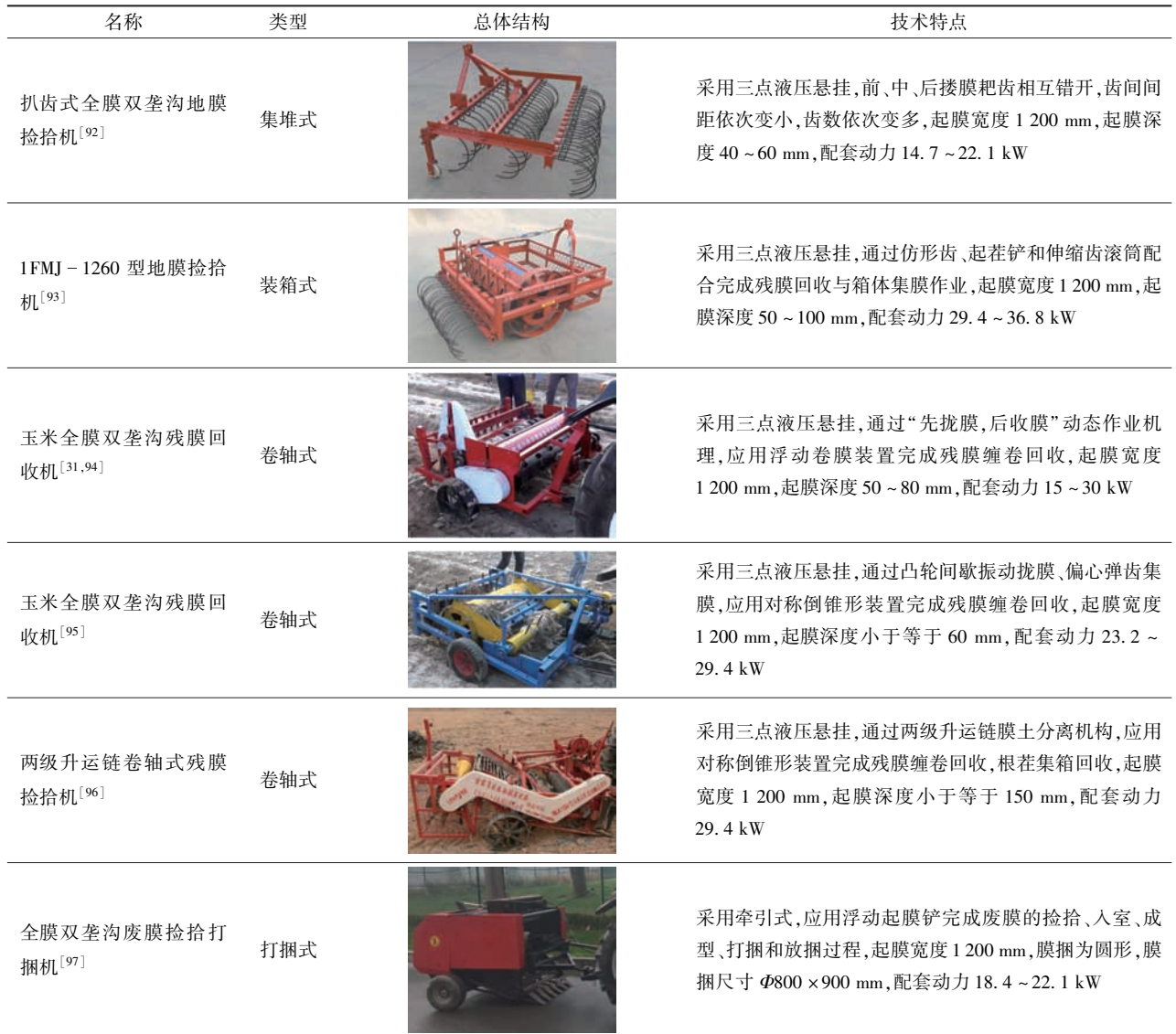
Tab.5 Typical machines for residual film collecting with whole plastic-film mulching on double ridges

内不同地域农作制要求,高效捡膜、膜杂分离机理与高性能机构研究已引起了农机学者的广泛关注。近期,陈学庚院士团队针对耐候膜开发系列化残膜回收装备,研制出能够随动整片捡膜的链板式钉齿捡拾装置和土壤、秸秆条带侧铺功能的螺旋清杂装置 [106] ,为残膜机械化回收提供了新思路与新途径。