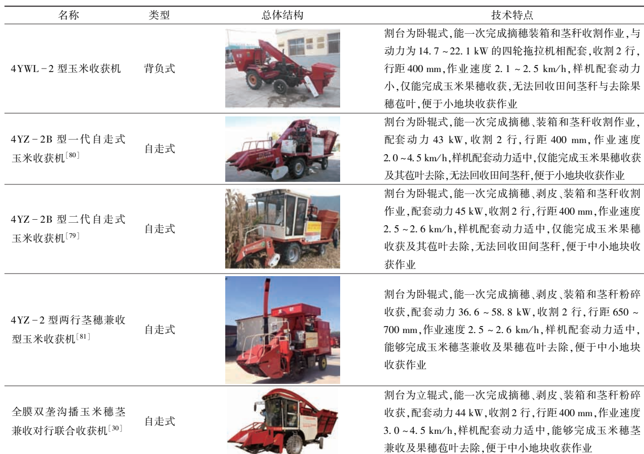
Tab. 4 Typical machines for corn mechanized harvesting with whole plastic-film mulching on double ridges

有结构简单、摘穗快等优点 [88-89] 。但是针对旱地玉米全膜双垄沟种植模式下的联合收获机械研究才开始尝试,辛尚龙等 [30] 设计了全膜双垄沟播玉米穗茎兼收对行联合收获机,目前仍处于进一步改进试制阶段。因此,沟播作物机械化收获属于全膜双垄沟播全程机械化相对薄弱的环节,也是未来机械化发展的主要方面。