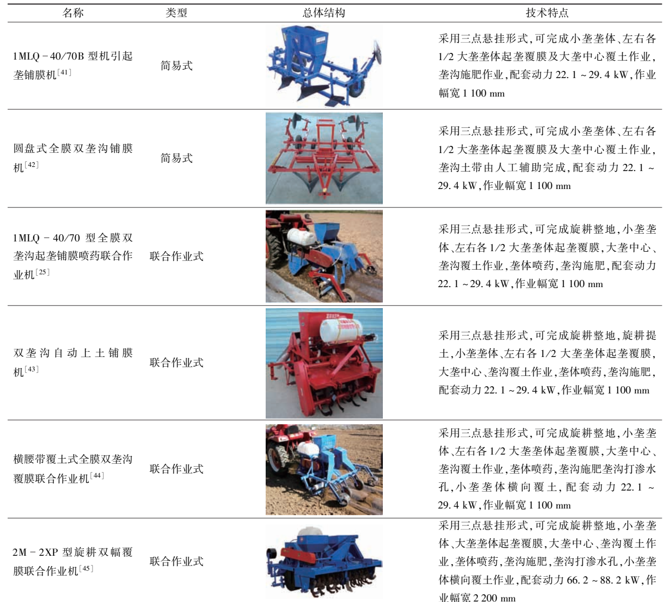
Tab. 2 Typical machines for ridging and plastic-film mulching with whole plastic-film mulching on double ridges

地膜覆盖农机装备的研发主要结合不同地域气候条件、种植作物品种、农作制及其农艺要求等进行配套设计,在作业机理与动力消耗方面存在较大差异。国外对于作物覆膜机械化栽培技术研究相对成熟,早在 20 世纪 90 年代末已有相关的作业机具出现 [46] 。其中,意大利、美国、以色列、日本等发达国家覆膜机械的工作性能可靠且一体化程度高,如法拉利 FPC 型全自动移栽机、雷纳多 RTME1100 型移