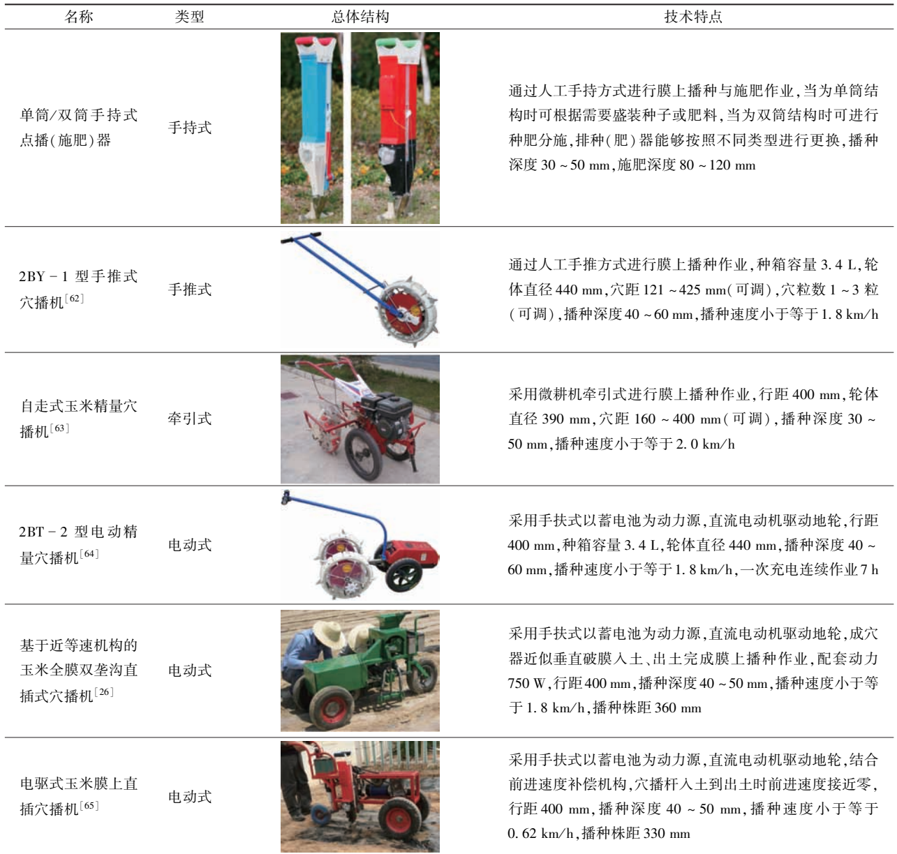
Tab.3 Typical machines for precision sowing on film with whole plastic-film mulching on double ridges

确保作物收获后双垄覆膜种床上残膜能够及时被高效率、高净度机械化回收,现有两种相对成熟作业模式:针对小型种植地块,先完成玉米果穗的收获,随后对田间滞留茎秆进行回收 [79] ;针对大型种植地块,应用携有穗茎兼收功能的联合收获机一次性完成玉米果穗的摘穗、输送、剥皮、收集和茎秆的切断、揉搓切碎、抛送、集车等作业工序 [30] 。相关全膜双垄沟机械化玉米收获典型机具如表4所示。