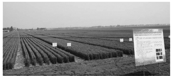
图1 青岛市保护性耕作体系试验区

保护性耕作为种植模式与播种量双因子、三水平、3次重复,共27小区,区组内小区随机排列,灌溉方式全部采用沟灌。传统耕作为单因子单水平、3次重复、3个小区,合计30个小区。为适应机械作业,试验小区长70 m、宽4.8 m,小区间隔带1 m,区组间隔带10 m,试验区占地1.5 hm 2 ,体系试验区见图1。除所试验的技术环节外,保护性耕作与传统对照的施肥量、灌水量及管理措施相同。